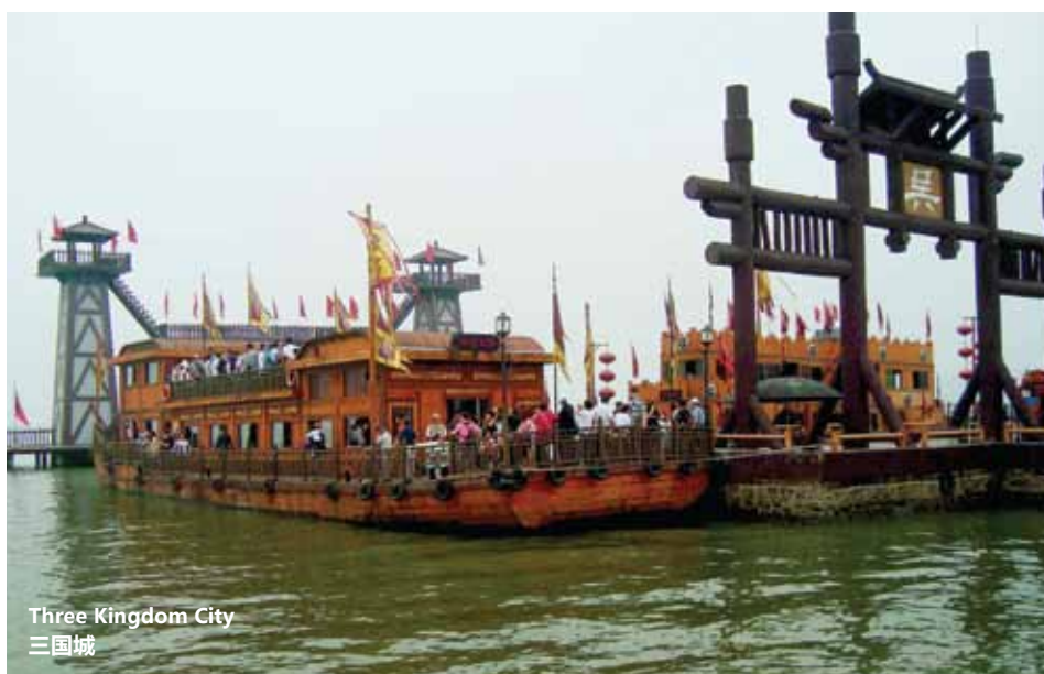
Three Kingdom City 三国城