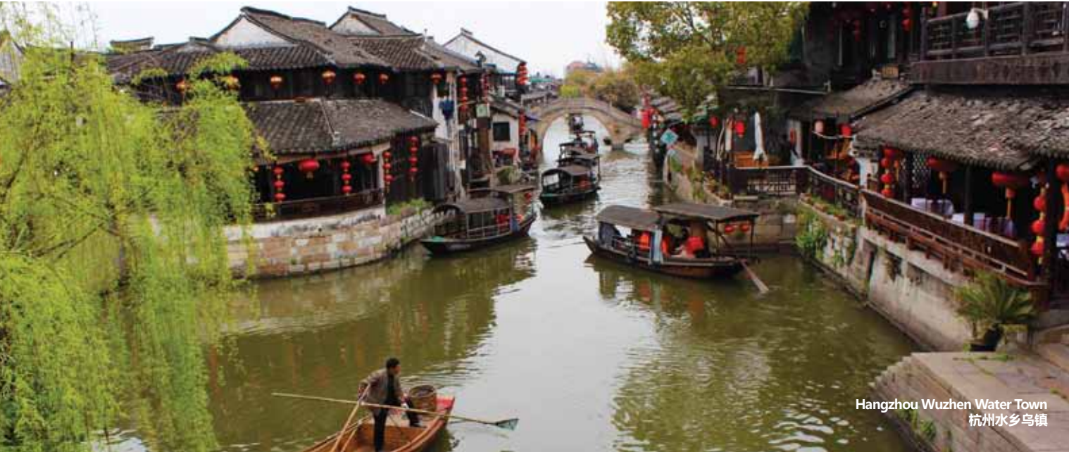
Hangzhou Wuzhen Water Town 杭州水乡乌镇

Hangzhou / Wuzhen / Suzhou / Wuxi / Nanjing / Shanghai 杭州 / 乌镇 / 苏州 / 无锡 / 南京 / 上海 /