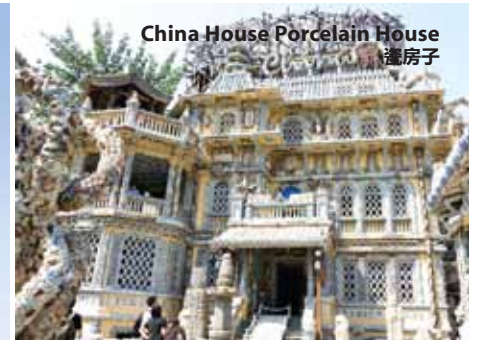
China House Porcelain House 瓷房子