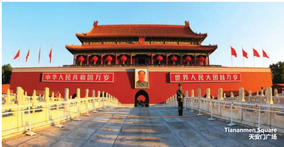
Tiananmen Square 天安门广场