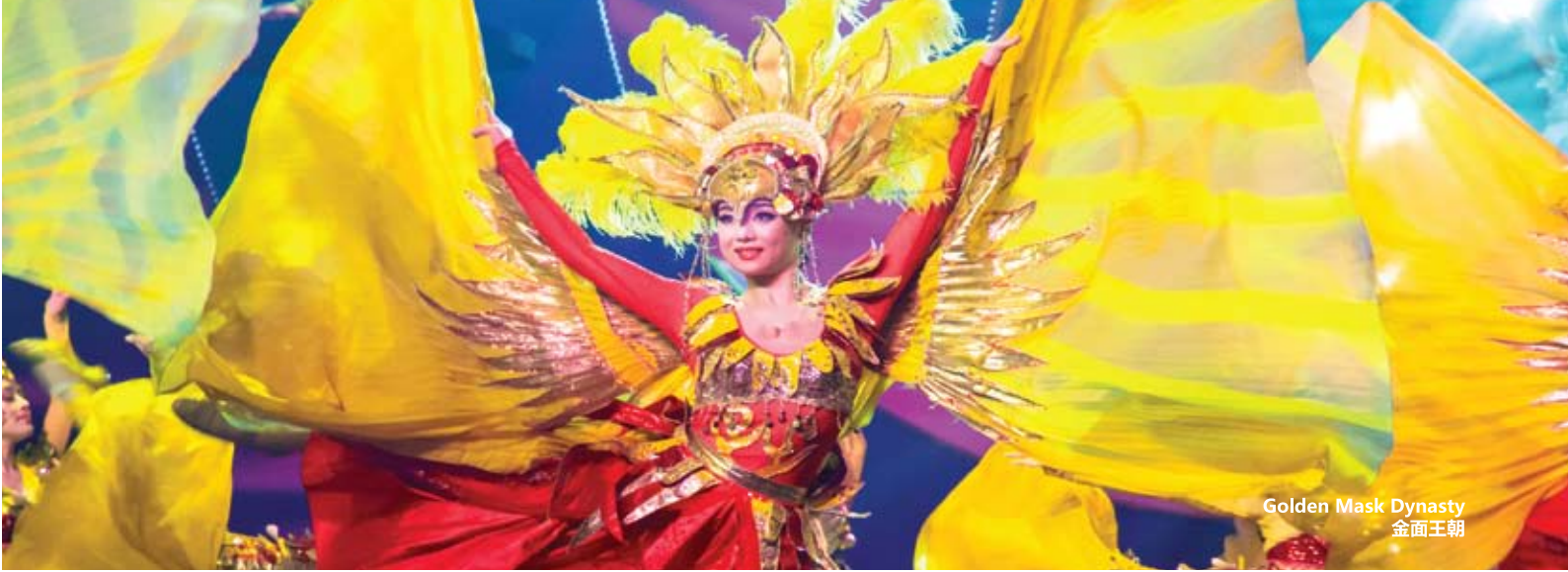
Golden Mask Dynasty 金面王朝