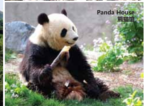
Panda House 熊猫馆