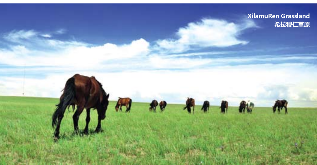
XilamuRen Grassland 希拉穆仁草原