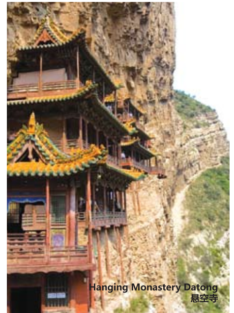
Hanging Monastery Datong 悬空寺