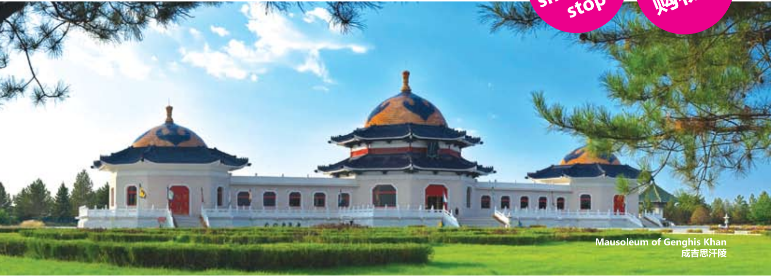
Mausoleum of Genghis Khan 成吉思汗陵