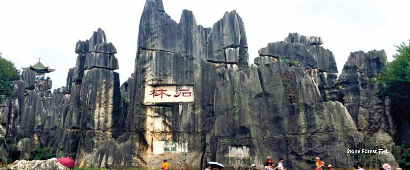
Stone Forest 石林