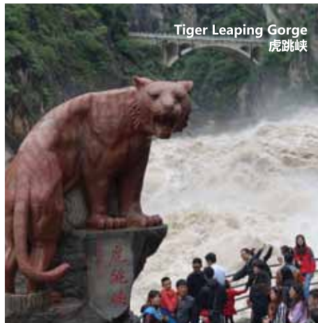
Tiger Leaping Gorge 虎跳峡