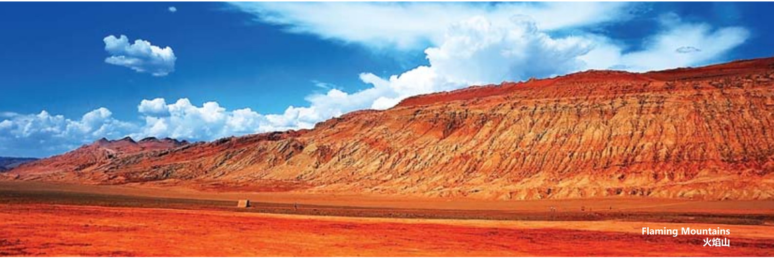
Flaming Mountains 火焰山