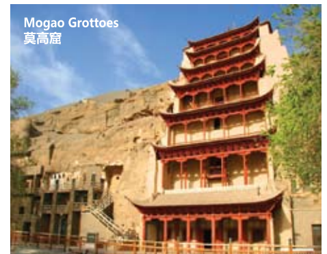
Mogao Grottoes 莫高窟