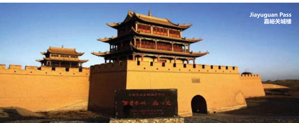
Jiayuguan Pass 嘉峪关城楼