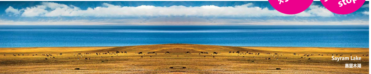
Sayram Lake 赛里木湖