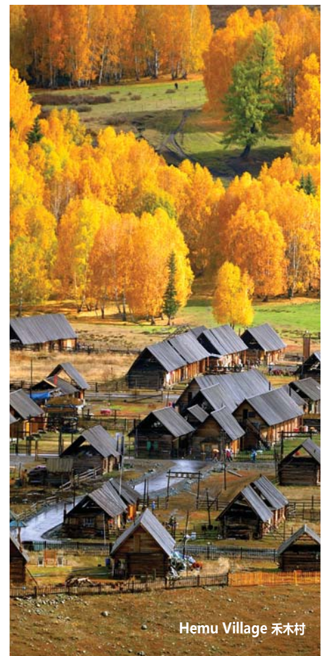
Hemu Village 禾木村