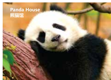
Panda House 熊猫馆