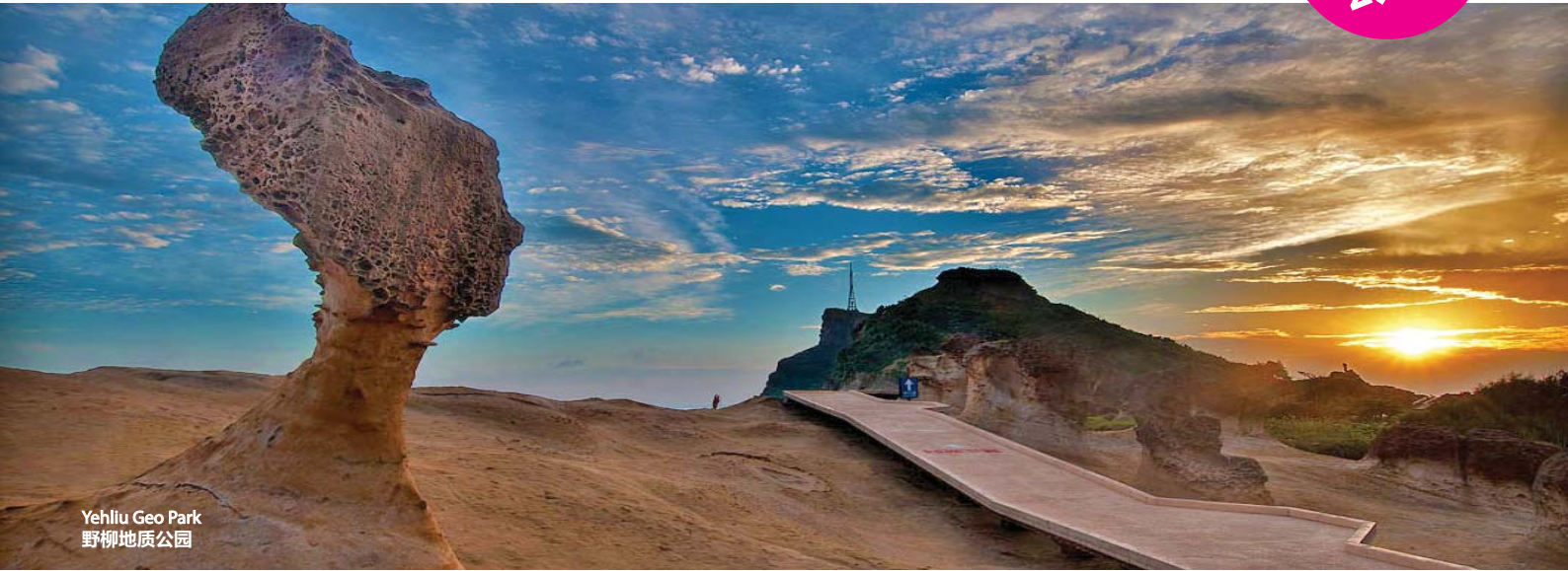
Yehliu Geo Park 野柳地质公园