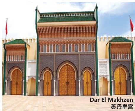
Dar El Makhzen 苏丹皇官