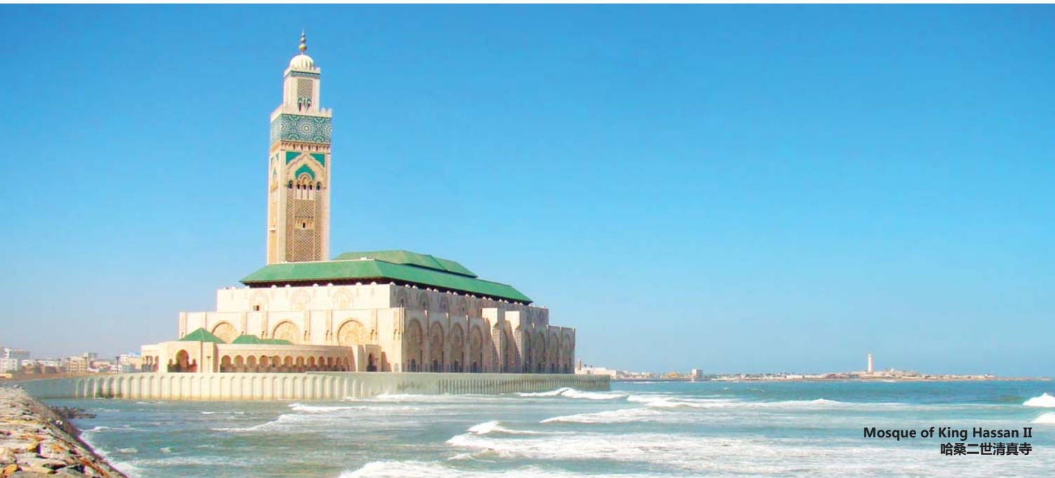
Mosque of King Hassan II 哈桑二世清真寺

马拉喀什 / 卡萨布兰卡 / 非斯 / 丹吉尔 / 阿尔赫西拉斯 / 塞维尔 / 科尔多瓦 / 马德里